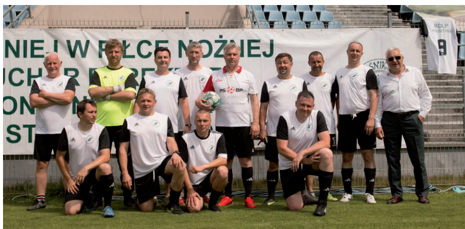
Drużyna reprezentująca Dyрекcję RDLP Olsztyn