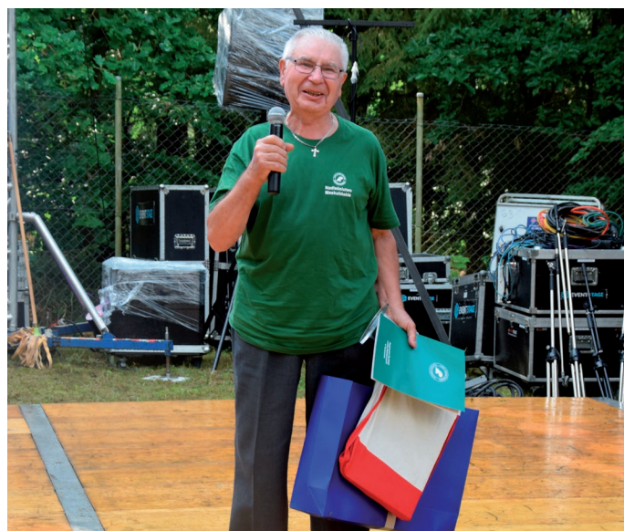
Najstarszy uczestnik Rajdu