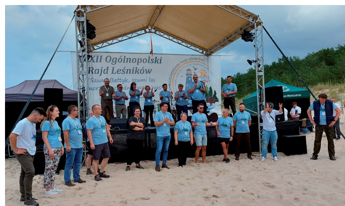
Zespół organizacyjny oraz koordynatorzy tras rajdowych