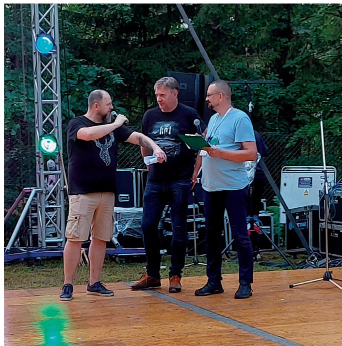
Motocyklista rajdowy, który przyjechał z najdalszego zakątka Polski