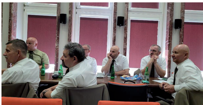
Członkowie Rady Regionu Radomskiego ZLP w RP podczas obrad