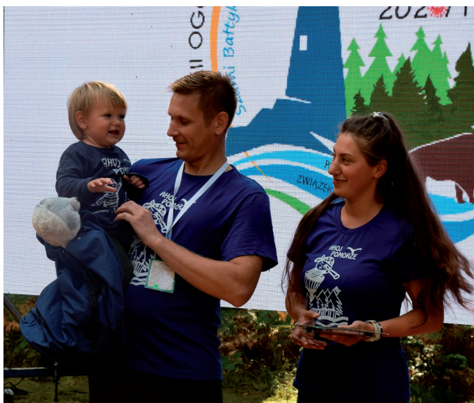
Najmłodszy uczestnik Rajdu