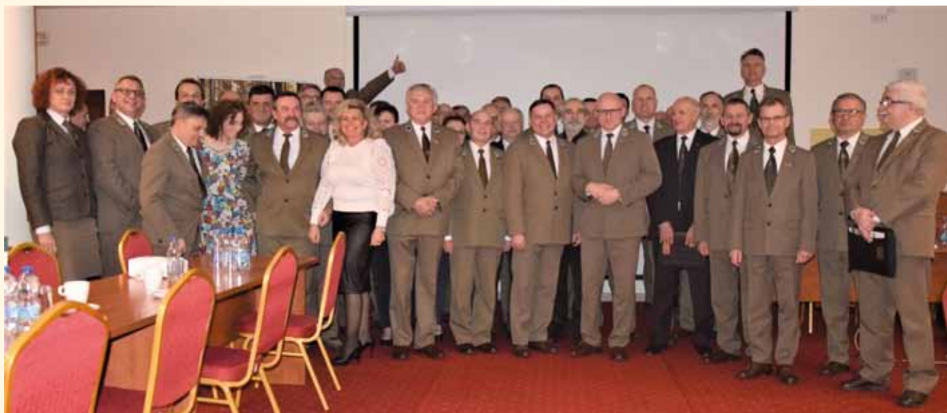
Pamiątkowe zdjęcie – Rada Krajowa i Komisja Rewizyjna ZLP w RP z kierownictwem Lasów Państwowych.