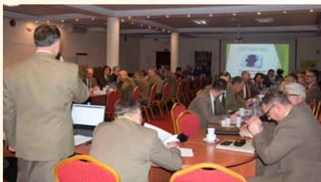
Członkowie Rady Krajowej i Krajowej Komisji Rewizyjnej.