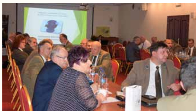
Członkowie Rady Krajowej i Krajowej Komisji Rewizyjnej.