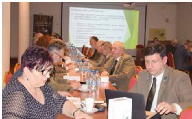
Członkowie Rady Krajowej i Krajowej Komisji Rewizyjnej ZLP w RP. Sękocin, 5-6 grudnia 2019 r.