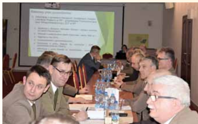
Członkowie Rady Krajowej ZLP w RP.

o zastąpieniu części sortów BHP z tabeli PUZP sortami mundurowymi oraz o okresach używalności odzieży. Planowane są kolejne spotkania w tej sprawie.