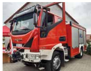
Samochód ratowniczo-gaśniczy OSP RP Województwa Lubuskiego.