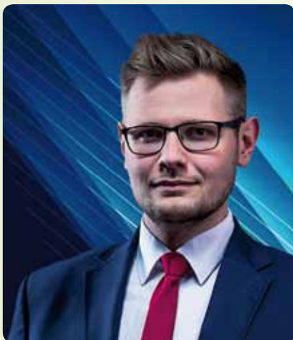
Michał Woś, Minister – Członek Rady Ministrów.

Michał Woś będzie nowym Ministrem Środowiska. Tą decyzją podzielił się premier Mateusz Morawiecki podczas ogłaszania nowego składu rządu 15 listopada 2019 roku. Tego dnia powołał Michała Wosia do rządu na stanowisko: Minister – Członek Rady Ministrów.