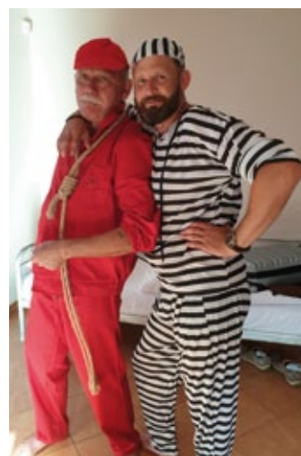
Reprezentacja drużyny w stroju więziennym.

Już organizujemy się na kolejny Ogólnopolski Rajd Leśników w 2020 roku. Do zobaczenia w Szczecinie.