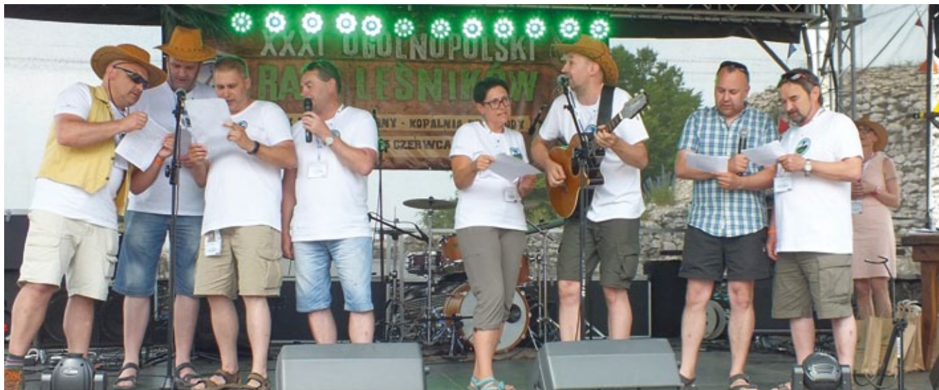
Prezentacja piosenki rajdowej.