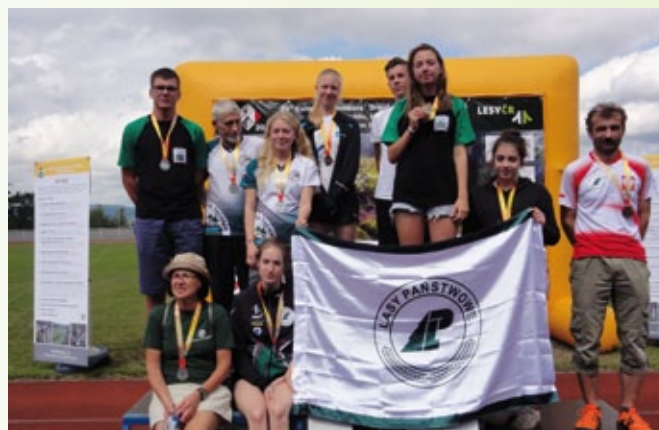
Laureaci XXVI Mistrzostw Europy Leśników w Biegu na Orientację.

Mistrzostwa przebiegały według następującego planu: