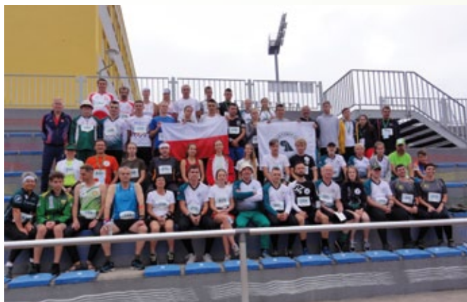
Uczestnicy XXVI Mistrzostw Europy Leśników w Biegu na Orientację.

W Czeskiej Republice w miejscowości Jablonec nad Nisou w dniach od 5 do 10 sierpnia 2019 r. odbyły się XXVI Mistrzostwa Europy Leśników w Biegu na Orientację. Ponad 350 zawodników, reprezentujących 15 państw europejskich, rywalizowało na trasach wytyczonych przez organizatorów w biegu sprinterskim. Oprócz pracowników Lasów Państwowych, uczestnikami Mistrzostw byli uczniowie średnich szkół leśnych (Goraj, Ruciane-Nida, Tuchola), studenci wydziałów leśnych, pracownicy BULiGL oraz członkowie leśnych rodzin.