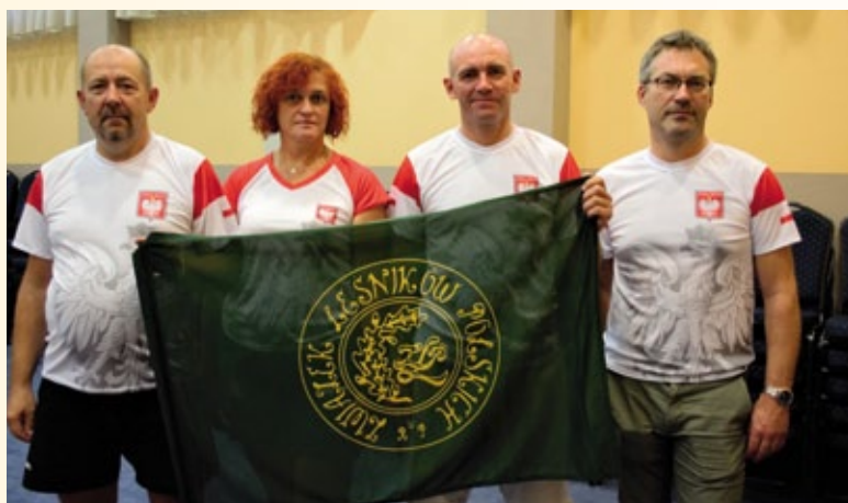
Drużyna ZLP w RP z Regionu Radomskiego gotowa do rozgrywek sportowych.