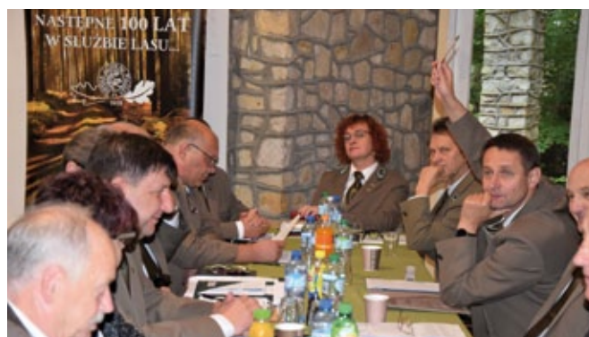
Członkowie Rady Krajowej ZLP w RP w trakcie obrad.

Członkowie Rady Krajowej ZLP w RP przyjęli także kilka uchwał, m.in. dotyczących nowych regulaminów przyznawania odznaczeń związkowych – odznaki „Zasłużony dla Leśników Polskich” oraz odznaczenia „Złoty Znak Związku”. Regulaminy są dostępne na stronie internetowej www.zlpwrp.pl w zakładce „Do pobrania”.