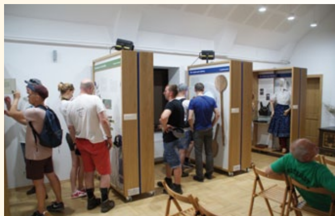
Dom Zielin „Przytulina”.