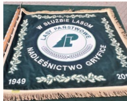
Sztandar Nadleśnictwa Gryfice.

Obszerna relacja z uroczystości znajduje się na stronie www.zlpwrrp.pl w zakładce „Aktualności”.