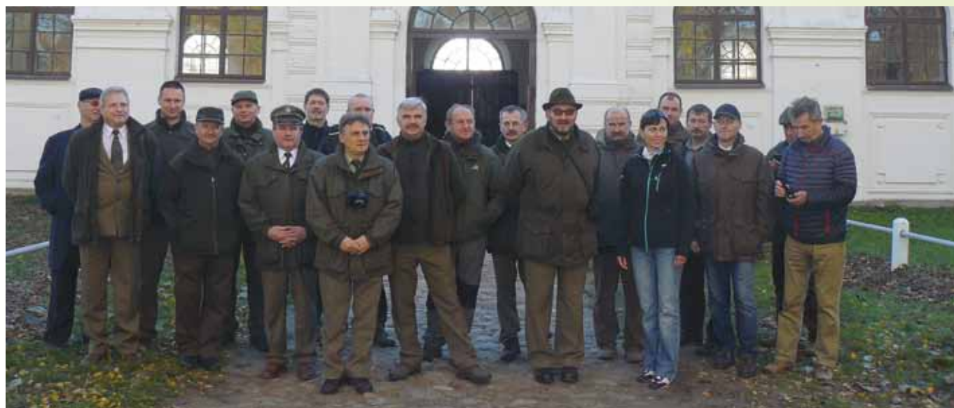
Wyjazdowe posiedzenie Rady Okręgu Lubelskiego ZLP 26 – 27.10.2015 r.

Związek Leśników Polskich Okręgu Lubelskiego, zgodnie z zapisami Statutu zawsze reprezentował interesy pracowników Lasów Państwowych budując dobre