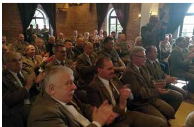
Zjazd Delegatów Regionu Dolnośląskiego