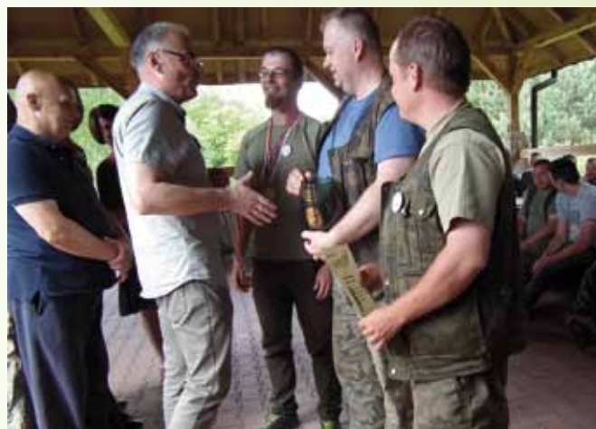
Wręczenie nagród podczas II Zawodów Wędkarskich o Puchar Przewodniczącego ZLP Okręgu Lubelskiego

O różnorodności podejmowanych przez ZLP Okręgu Lubelskiego działań na rekreacyjnej niwie świadczy organizowanie Zawodów Wędkarskich o Puchar Przewodniczącego Związku Leśników Polskich Okręgu Lubelskiego. Impreza ta weszła na stałe do kalendarza działalności Rady Okręgu i cieszy się coraz większym zainteresowaniem wśród leśnych załóg. W roku 2017 miejscem zmagania wędkarzy było urokliwe jezioro Gliniki na terenie Nadleśnictwa Sobibór, a głównym orga-