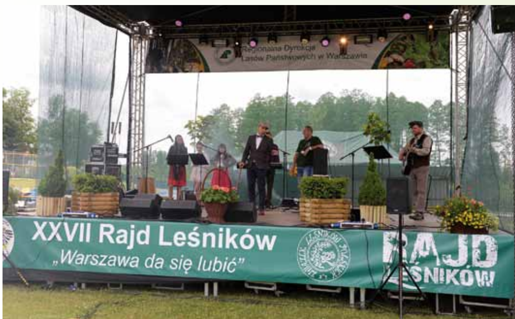
Final Rajdu Leśników „Warszawa da się lubić”, Mrozy 2015

95-lecia Związku Leśników Polskich w RP. W obchodach wzięło udział ok. 100 osób. Z tej okazji dyrektor Regionalnej Dyrekcji w Warszawie uhonorował 2 naszych członków Kordelasem Leśnika Polskiego. Przyznano i wręczono 45 odznaczeń Związkowych.