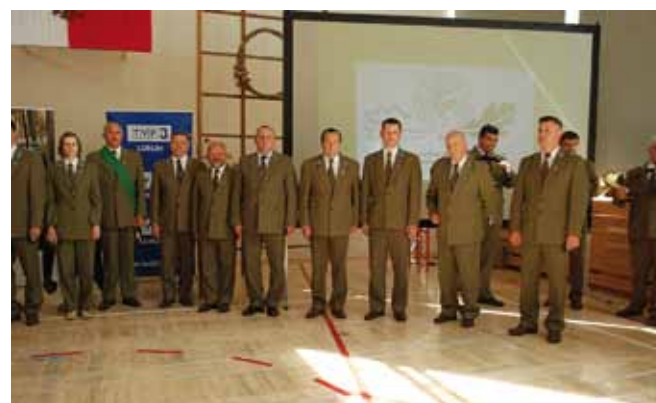
Odnaczeni Brązową Odznaką „Zasłużony dla Leśników Polskich”