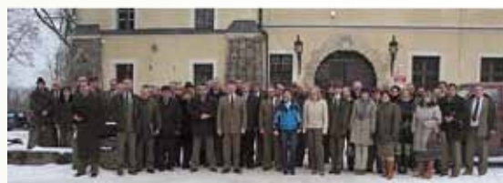
Delegaci i goście Zjazdu Sprawozdawczo-Wyborczego 22.02.2013 r. Technikum Leśne w Goraju