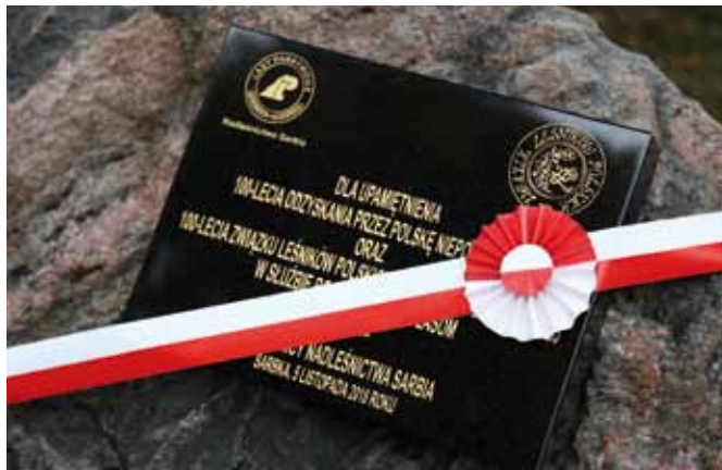
Kamień z tablicą pamiątkową, ustawiony przy obiekcie Nadleśnictwa Sarbia

„Z pewnością jednak jutro dla wszystkich leśników i ludzi lasu będzie niesłychanie ważny dzień, który należy godnie uczcić. Leśnicy to ludzie, którzy mają