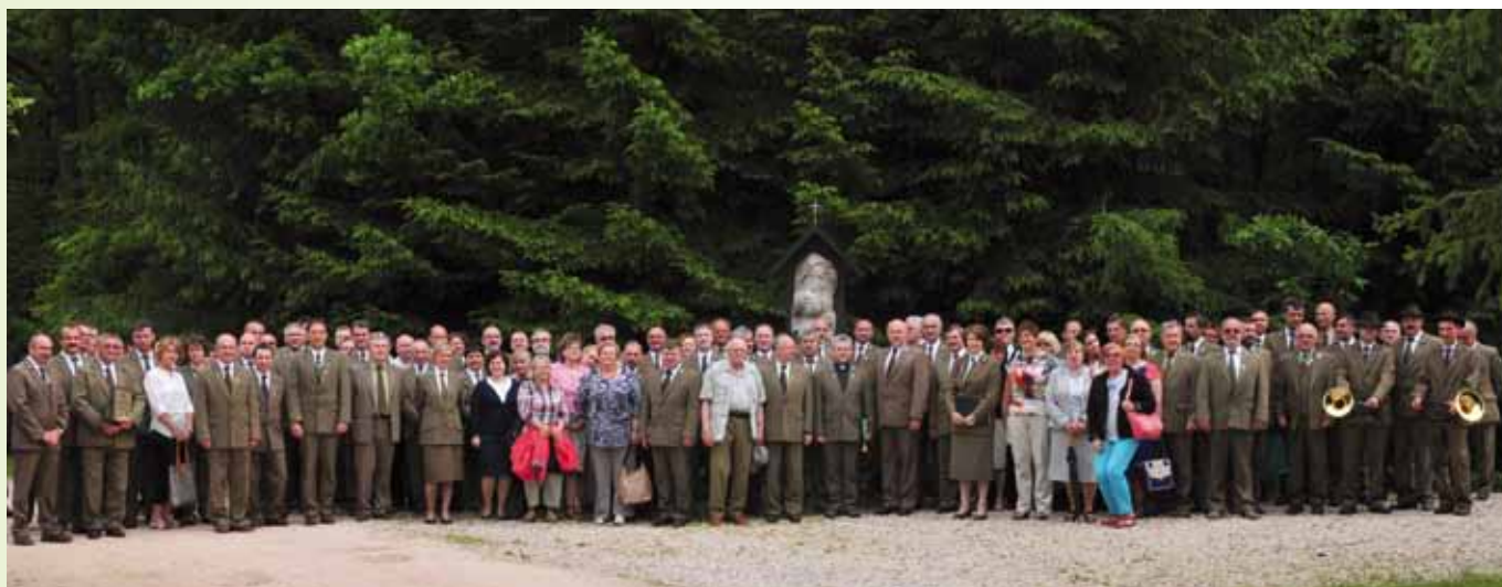
Uczestnicy uroczystości 95-lecia Związku w Okręgu Warszawskim

13 czerwca 2015 r. w Centrum Edukacji Leśnej w Nadleśnictwie Celestynów zorganizowano obchody