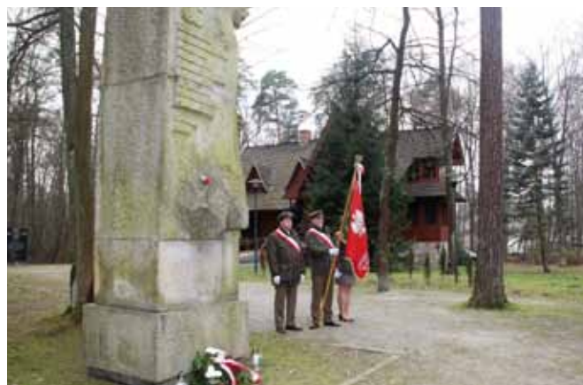
Pomnik Poległych Leśników i Drzewiarzy. Poczet Sztandarowy