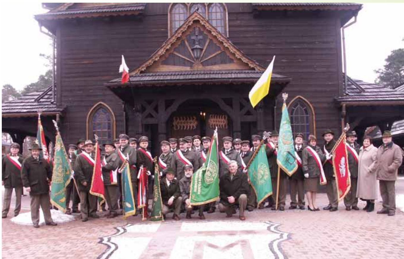
Zdjęcie znalazło się w wydaniu Leśnika nr 3–4(131) Marzec, Kwiecień 2009 z opisem: Pamiątkowe zdjęcie z pocztami sztandarowymi przed kościołem w Jedlni Letnisko.

27 listopada 2008 r. odbył się Zjazd Sprawozdawczy ZLP OW połączony z regionalnymi obchodami 90-lecia