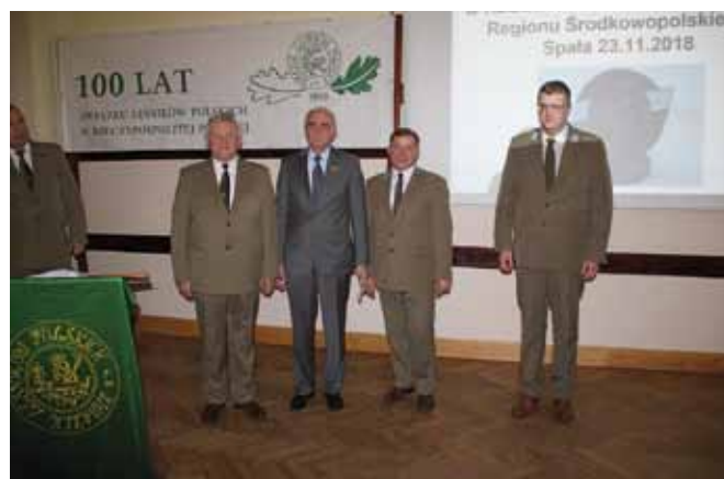
Wyróżniony Brązowym Odznaczeniem