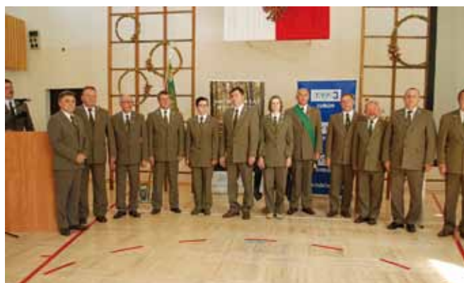
Odnaczeni Brązową Odznaką „Zasłużony dla Leśników Polskich”