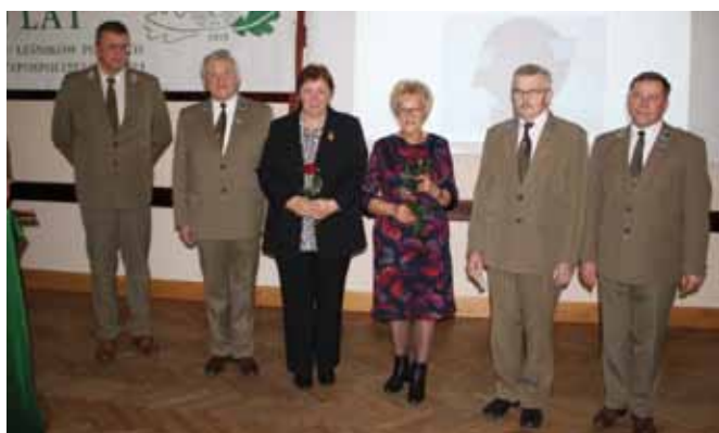
Wyróżnieni Złotymi Odznaczeniami

Srebrne odznaczenie „Zasłużony dla Leśników Polskich” otrzymali: