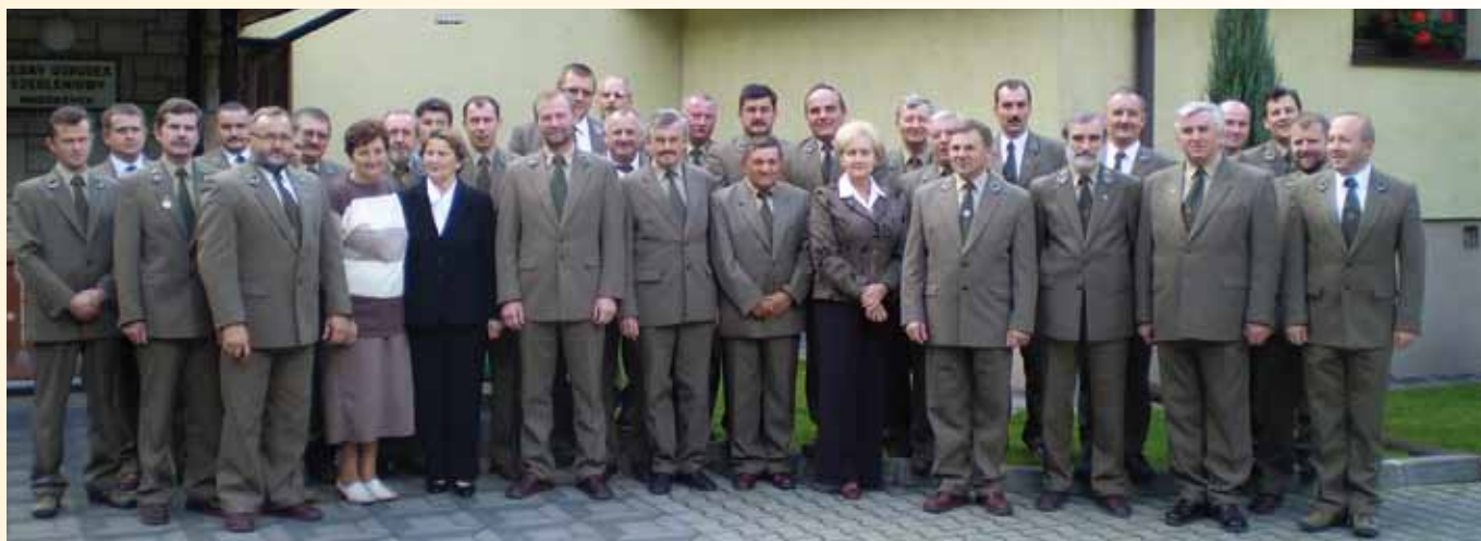
Delegaci i goście Zjazdu Sprawozdawczo-Wyborczego ZLP RŚ w Łodzi w 2007 r.