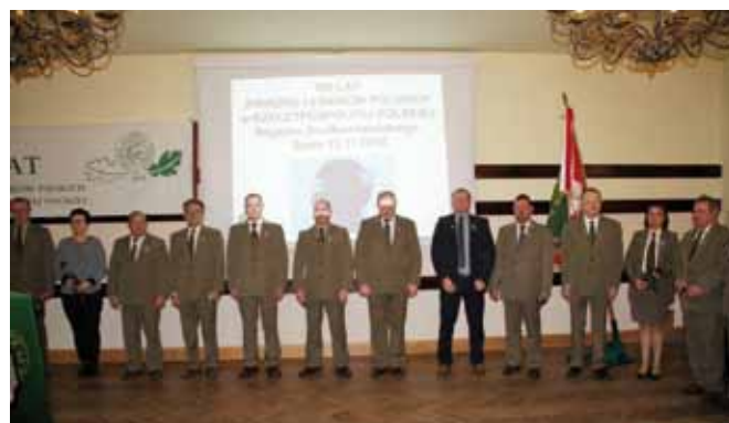
Wyróżnieni Srebrnymi Odznaczeniami

Brązowe odznaczenie „Zasłużony dla Leśników Polskich” otrzymał: