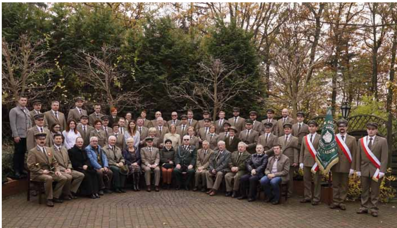
Zdjęcie zbiorowe uczestników uroczystości