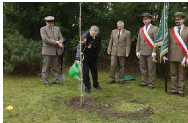
Sadzenie Dęba Niepodległości