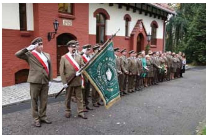
Zbiórka pracowników Nadleśnictwa Sarbia, w dniu 5 listopada 2018 r. – uroczysty apel

Nadleśnictwo Sarbia udekorowano flagami już 5 listopada 2018 r., w tym dniu rozpoczęto uroczystości obchodów 100-lecia odzyskania Niepodległości Państwa Polskiego i 100-lecia powstania Związku Leśników Polskich w Rzeczypospolitej Polskiej. Zaproszeni goście i pracownicy Nadleśnictwa Sarbia z samego rana stanęli do uroczystego apelu, aby upamiętnić te ważne wydarzenia. Na tą okoliczność ustawiono przy obiekcie Nadleśnictwa kamień z tablicą pamiątkową oraz posadzono Dąb Niepodległości, którego sadzonka została pobłogosławiona przez Papieża Franciszka podczas pielgrzymki delegatów Lasów Państwowych w Polsce w 2018 r. do Grobu św. Jana Pawła II, Papieża Polaka.