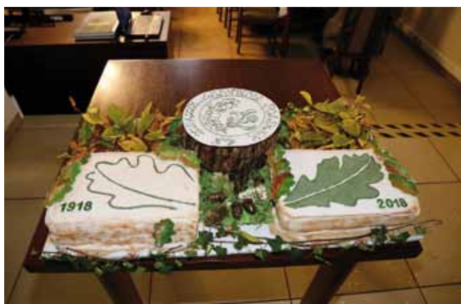
Tort – wypieki okolicznościowe