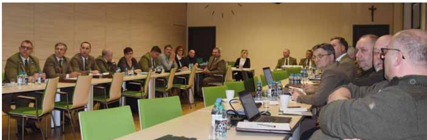
Rada Krajowa ZLP w RP