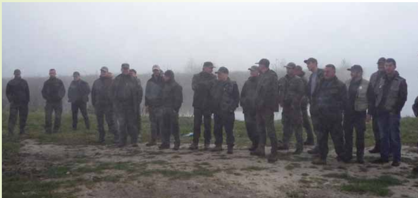
Odprawa o świcie