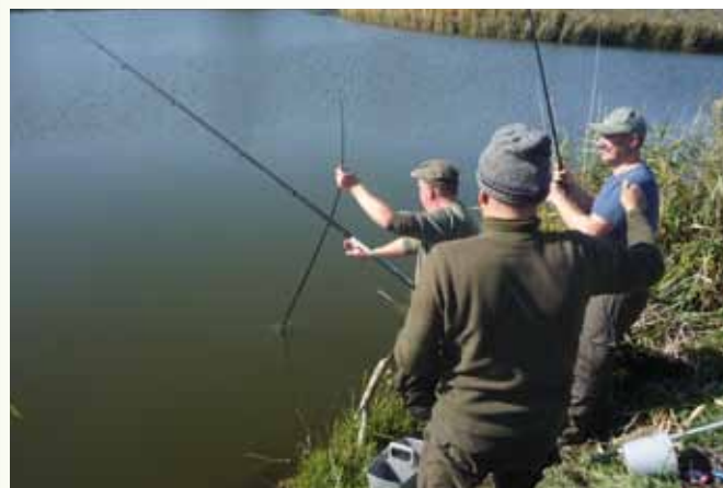
Zaraz, zaraz... miały być łowione ryby!