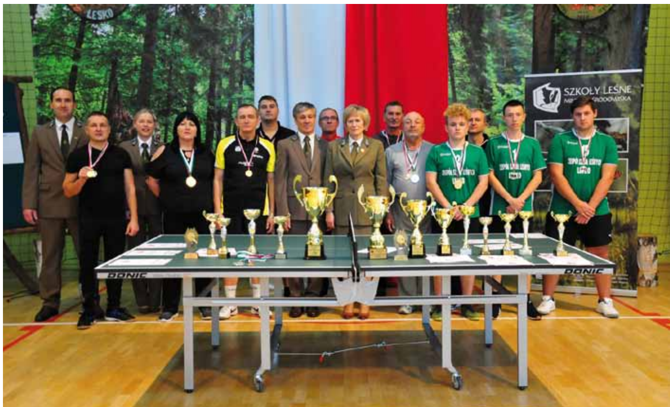
Zakończenie Turnieju Tenisa Stołowego o Puchar Związku Leśników Polskich w RP

Sponsorami tegorocznej edycji byli: Związek Leśników Polskich w Rzeczypospolitej Polskiej, Związek Leśników Polskich w RP Regionu Krośnieńskiego oraz Związek Leśników Polskich Organizacja Zakładowa Pracowników ZSL w Lesku. Serdeczne podziękowania należą się również Stowarzyszeniu Absolwentów i Przyjaciół ZSL w Lesku, które ufundowało dwa profesjonalne stoły do tenisa.