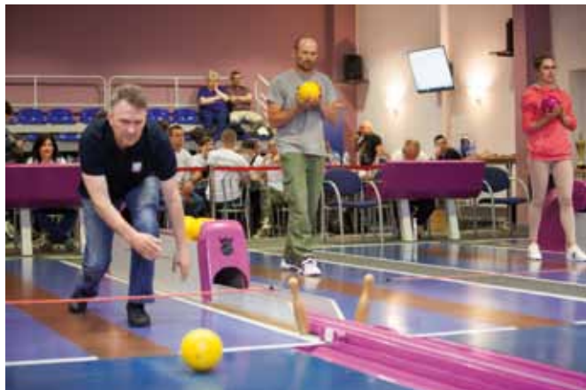
Zawodnicy w akcji

W dniu 12.05.2018 r. odbył się we Wronkach trzy-nasty z kolei Turniej Kręglarski Leśników Piłskich. Organizatorem zawodów był Związek Leśników Polskich w RP przy Nadleśnictwie Wronki.