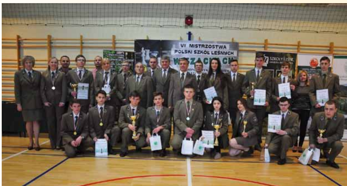
Uczestnicy VII Mistrzostw Szkół Leśnych w Szachach pod Honorowym Patronatem Związku Leśników Polskich w RP

W Rezerwacie podziwialiśmy ponaddwudziestometrowe ostańce skalne, zbudowane z gruboziarnistego piaskowca ciężkowieckiego, który pod wpływem erozji przybrał oryginalne kształty. Prądkki, jedyny rezerwat skalny w południowo-wschodniej Polsce, dostarczyły nam wielu wrażeń.