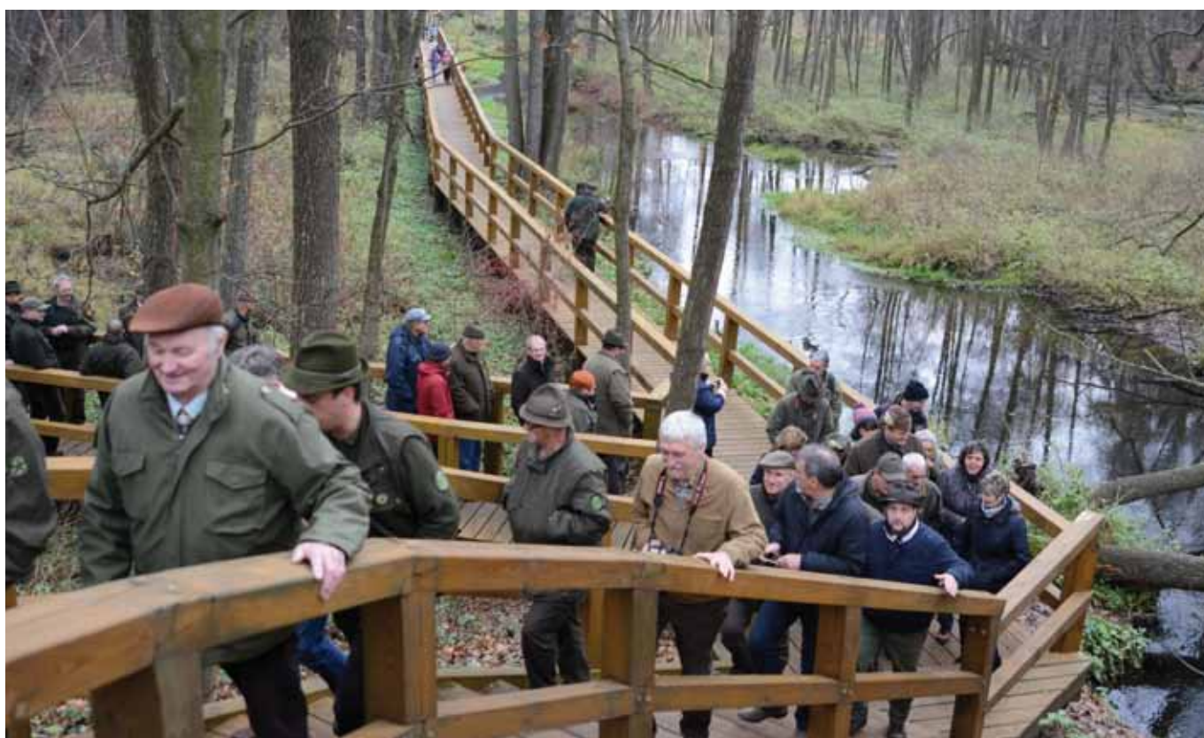
Teren Nadleśnictwa Kozienice, LKP „Puszcza Kozienicka”