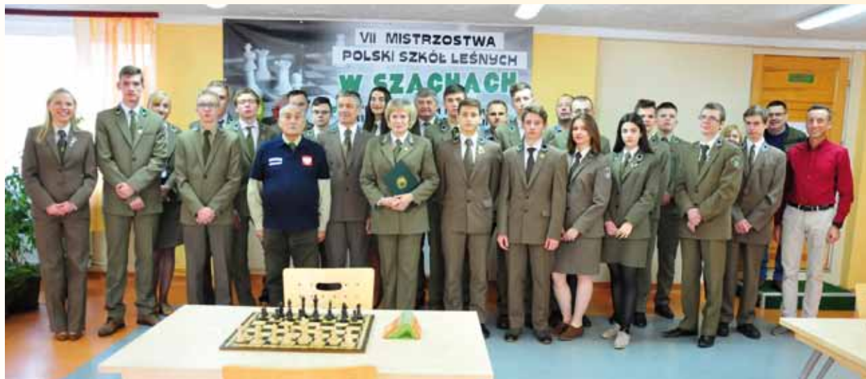
Rozpoczęcie VII Mistrzostw Polski Szkół Leśnych w Szachach pod Honorowym Patronatem Związku Leśników Polskich w RP

W dniach 19-21 listopada 2018 r. Zespół Szkół Leśnych w Lesku był organizatorem VII Szachowych Mistrzostw Polski Szkół Leśnych. Od trzech lat zmaganiom młodych szachistów honorowo patronuje Związek Leśników Polskich w RP.