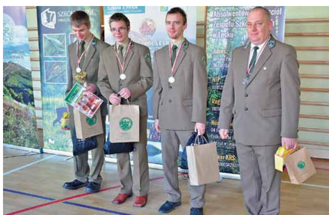
Laureaci Mistrzostw Szachowych Szkół Leśnych.

turniej indywidualny: http://www.chessarbiter.com/turnieje/2016/ti_6508/