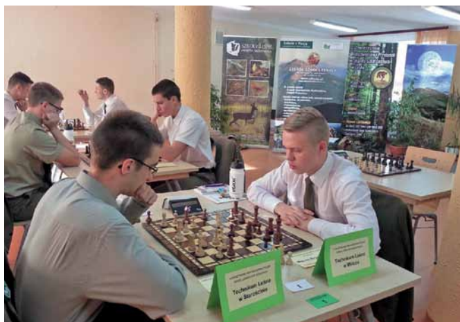
Rozgrywki szachowe uczniów Technikum Leśnego – na pierwszym planie reprezentanci Technikum Leśnego w Staroście i Miliczu.

Zespół Szkół Leśnych w Lesku gościł w tych dniach Technika Leśne z Białowieży, Milicza, Starościna oraz Rucianego – Nidy. Uczestnicy obowiązkowo rozegrali turniej drużynowy systemem „każdy z każdym” oraz turniej indywidualny systemem „szwajcarskim” – 9 rund. Ostatniego dnia zmagani dla wszystkich chętnych, również Opiekunów, odbył się turniej gry błyskawicznej, z czasem po 5 minut na zawodnika.