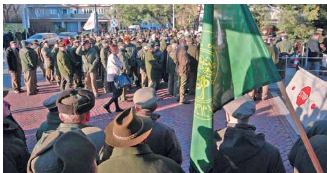
Leśnicy z ZLP Regionu Radomskiego przybyli przed gmach Sejmu RP w licznej – 80-osobowej reprezentacji.

Darz Bór! Bronisław Sasin Przewodniczący ZLP w RP