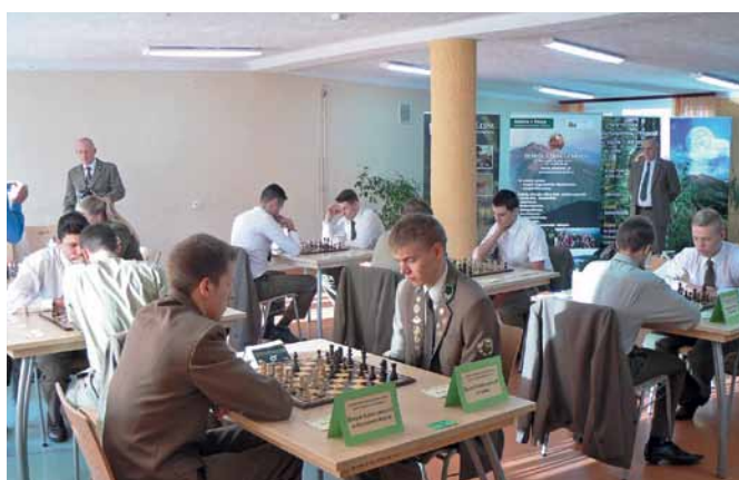
Rozgrywki szachowe uczniów Technikum Leśnego – na pierwszym planie reprezentanci Zespołu Szkół Leśnych w Rucianym – Nidzie i Lesku.