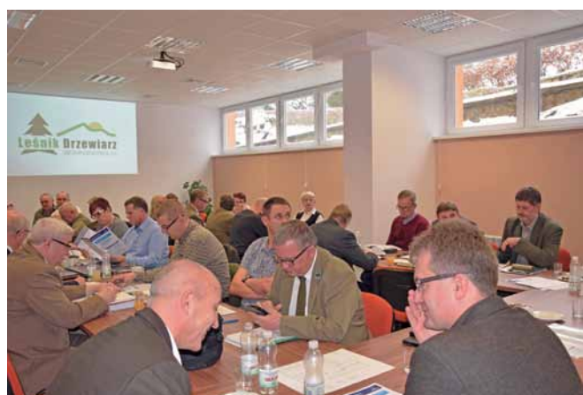
Członkowie Rady Krajowej ZLP w RP.

Niestety minister rolnictwa i rozwoju wsi, Krzysztof Jurgiel, niedawno wrócił do pomysłu obciążenia leśników obowiązkiem szacowania szkód łowieckich. Dyrekcja Generalna LP przygotowała opinię w tej sprawie, w której argumentuje m.in., że Lasy Państwowe nie dysponują kadrą wykwalifikowaną w zakresie rolnictwa i szacowania szkód w uprawach i płodach rolnych, a przyjęcie tego obowiązku wiązało by się z koniecznością zatrudnienia przynajmniej jednej osoby w każdym z 430 nadleśnictw.