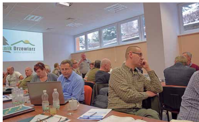
Członkowie Rady Krajowej ZLP w RP.