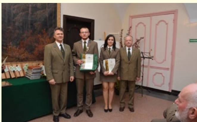
Stypendyści ZLP w RP – ZSL w Goraju.