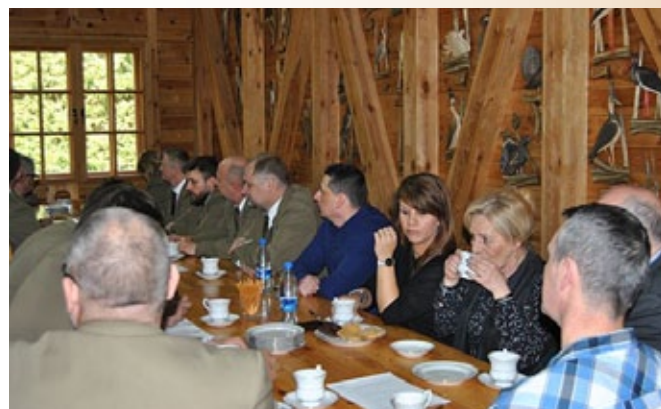
Delegaci na Zjazd.