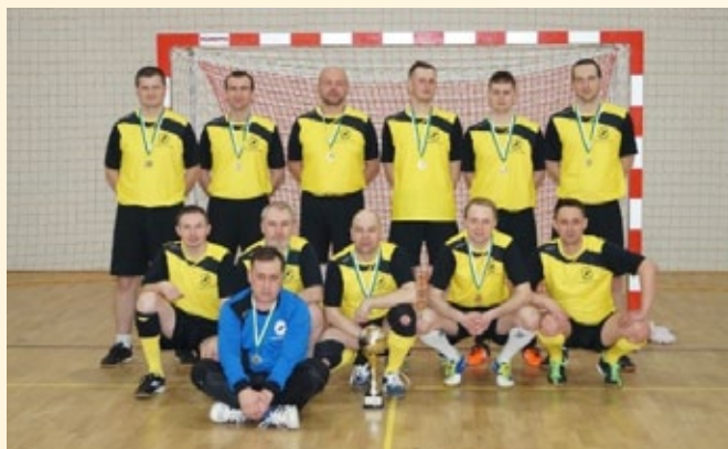
I-sze miejsce – Nadleśnictwo Kaliska