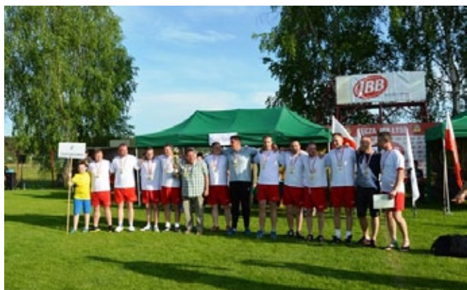
I m-ce Zaporowo.