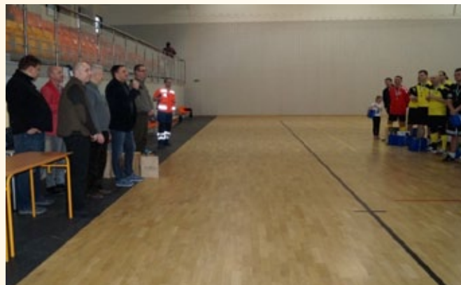
Wręczenie nagród przez przybyłych Gości i Sponsorów.