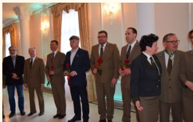
Odnaczeni brązowymi odznakami „Zasłużony dla Leśników Polskich”.