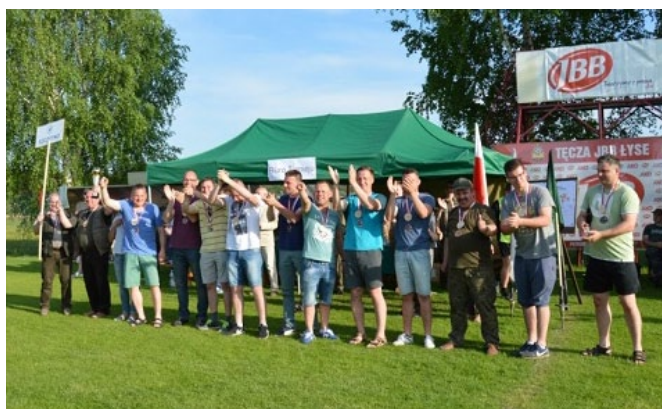
III m-ce Szczytno.