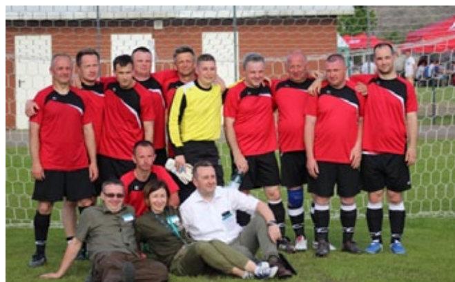
IV m-ce Myszyniec.