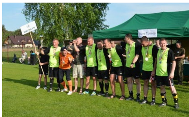
II m-ce Miłomłyn.