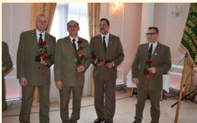
Odnaczeni srebrnymi odznakami „Zasłużony dla Leśników Polskich”.