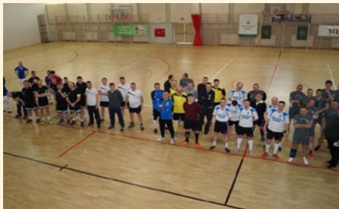
Zakończenie zawodów – rozdanie medali i upominków.