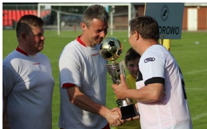
Wręczenie Pucharu Dyrektora.