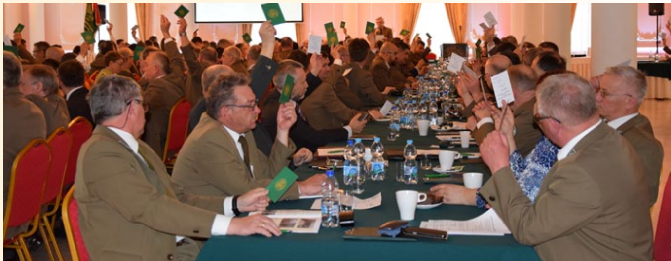
Delegaci na Zjazd – sala obrad.