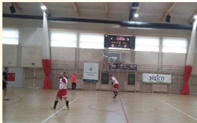
Zawodnicy w trakcie gry.