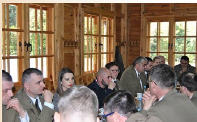
Delegaci na Zjazd.