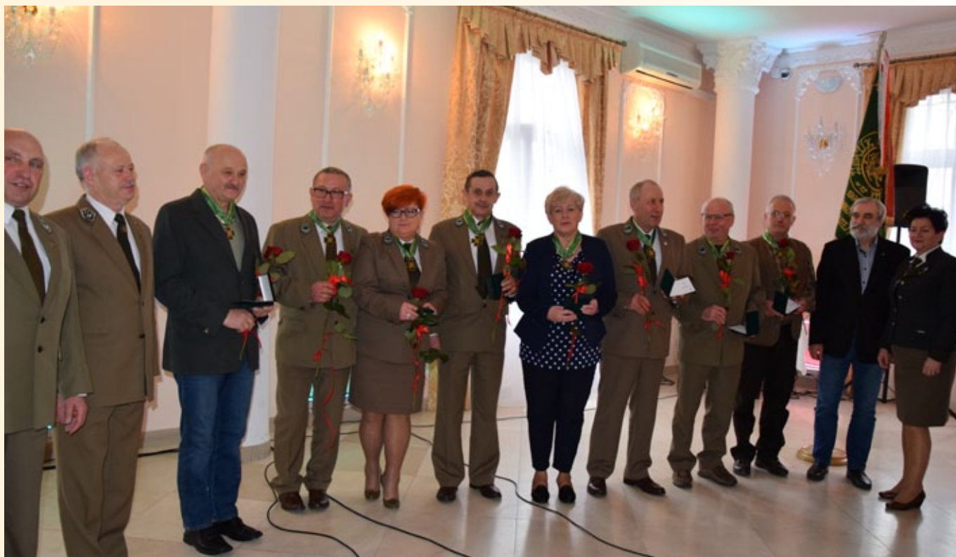
Członkowie ZLP w RP wyróżnieni Złotym Znakiem Związku.