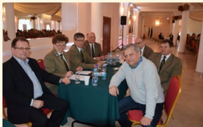
Członkowie Komisji Skrutacyjno-Mandatowej.