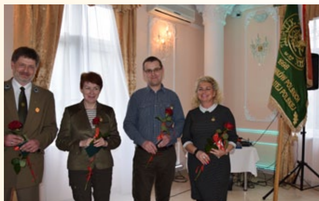
Odnaczeni złotymi odznakami „Zasłużony dla Leśników Polskich”.