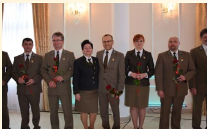
Odnaczeni złotymi odznakami „Zasłużony dla Leśników Polskich”.