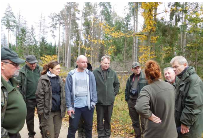
Na powierzchni Hajnówka