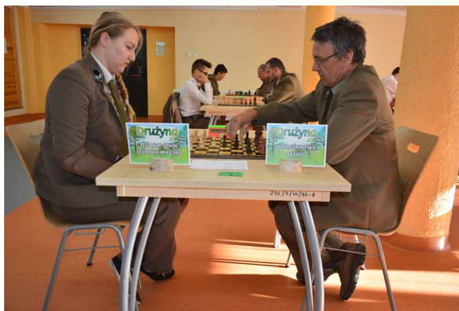
Rozgrywki drużynowe po lewej reprezentanci Technikum w Lesku po prawej zaproszona drużyna z Nadleśnictwa Lesko