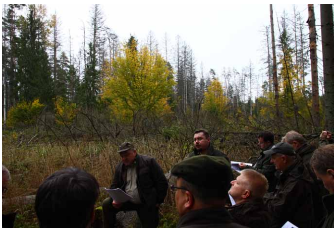
Na powierzchni pokornikowej w obrębie Narewka