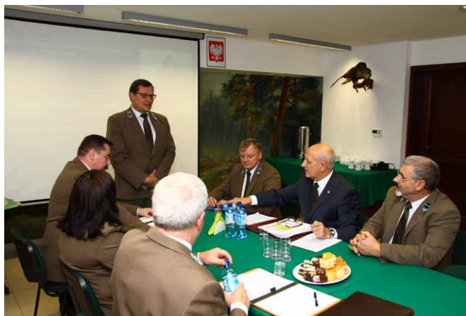
Głos zabiera Dyrektor RDLP w Białymstoku

W godzinach popołudniowych mieliśmy wyjazd na teren obrębu Narewka w celu zapoznania się z rozmia-