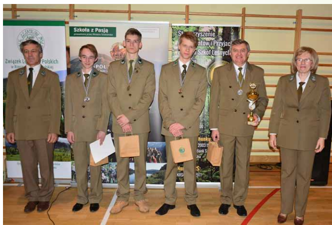
II miejsce – drużyna Zespołu Szkół Leśnych w Zagnańsku