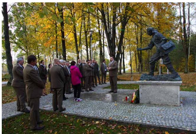
Rada pod pomnikiem INKI

rami gradacji kornika drukarza, jej skutkami a także z prowadzonymi odnowieniami naturalnymi na terenie nadleśnictwa.