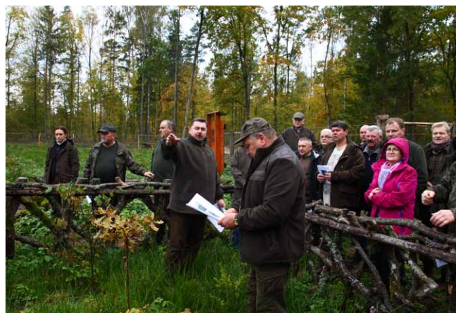
Na powierzchni odnowionej w obrębie Narewka