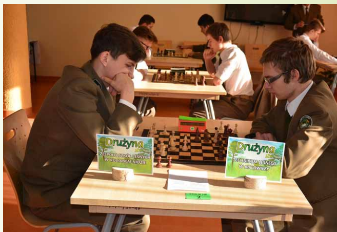
Rozgrywki szachowe uczniów Technikum Leśnego po lewej reprezentanci Technikum w Rucianem- Nidzie po prawej Technikum w Białowieży