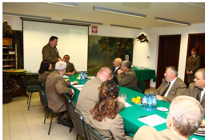
Mówi Nadleśniczy Nadleśnictwa Browsk