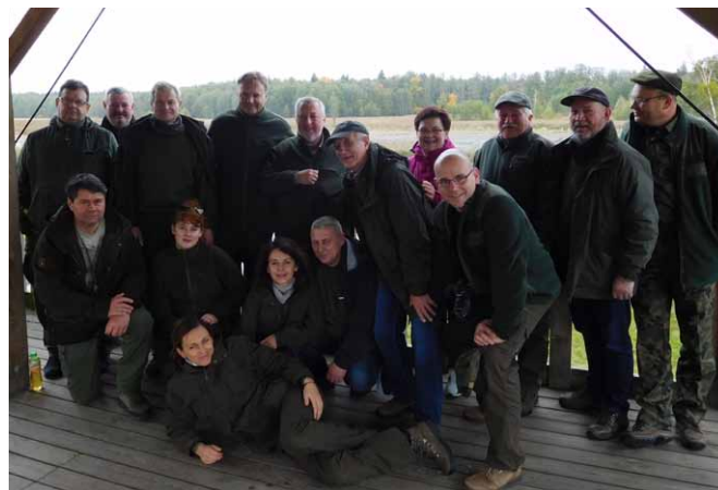
Na wieży widokowej w Nadleśnictwie Hajnówka

pobytu w Białowieży obejrzelśmy zagrodę pokazową BPN oraz przeszliśmy ścieżką „Zebra Żubra”. Niektórzy z członków Rady Regionu mieli okazję odwiedzić miejsca, w których byli przed laty, czasem wielu laty podczas nauki w tutejszym Technikum Leśnym. Po południu spotkaliśmy się z leśniczym leśnictwa Pasieki, który opowiedział o istniejących w okolicy pradawnych kurhanach.