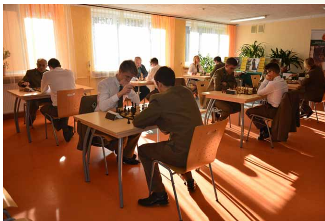
Rozgrywki szachowe uczniów Technikum Leśnego