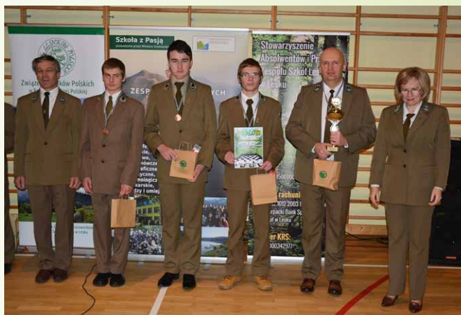
III miejsce – drużyna Technikum Leśnego w Białowieży